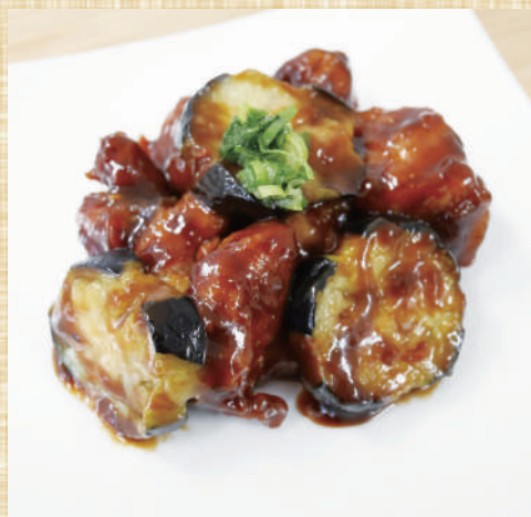
自然解凍OK ストライプ揚げなす コインカットの赤味噌炒め