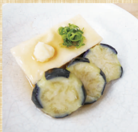
自然解凍OK ストライプ揚げなす コインカットの揚げ出し