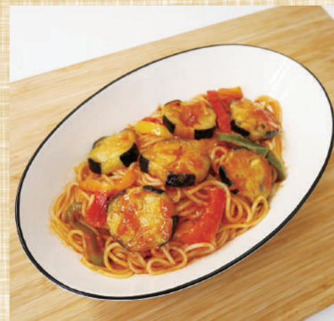
自然解凍OK ストライプ揚げなす コインカットのトマトパスタ