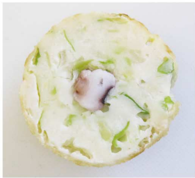
通常のだこ焼 断面