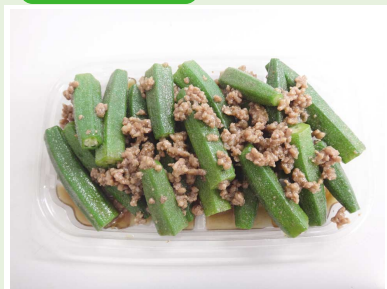
オクラそぼろ和え