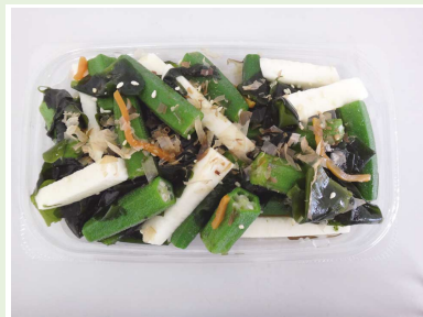
オクラと山芋の和え物