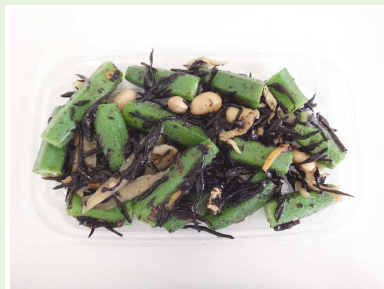
オクラひじき和え